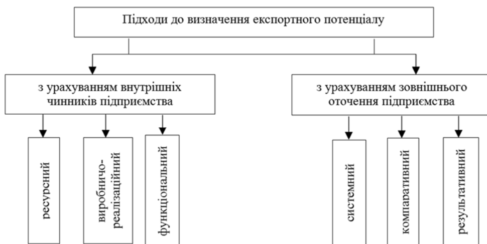
Рисунок 1 – Систематизація підходів визначення експортного потенціалу

Підходи визначення експортного потенціалу з урахуванням внутрішніх чинників підприємства надають змогу оцінити ресурсний потенціал підприємства через наявність