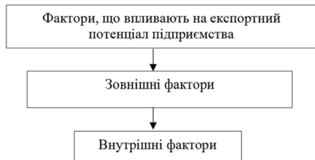
Рисунок 2 – Фактори, що впливають на експортний потенціал підприємства

Вважаємо за потрібне представити класифікацію факторів, що впливають на формування експортного потенціалу за схемою, наведеною на рис. 2.