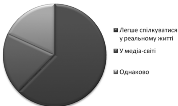
Рисунок 2 – Діаграма результатів діагностики учнів 11-х класів

«Де легше спілкуватись: у медійному чи реальному світі?»